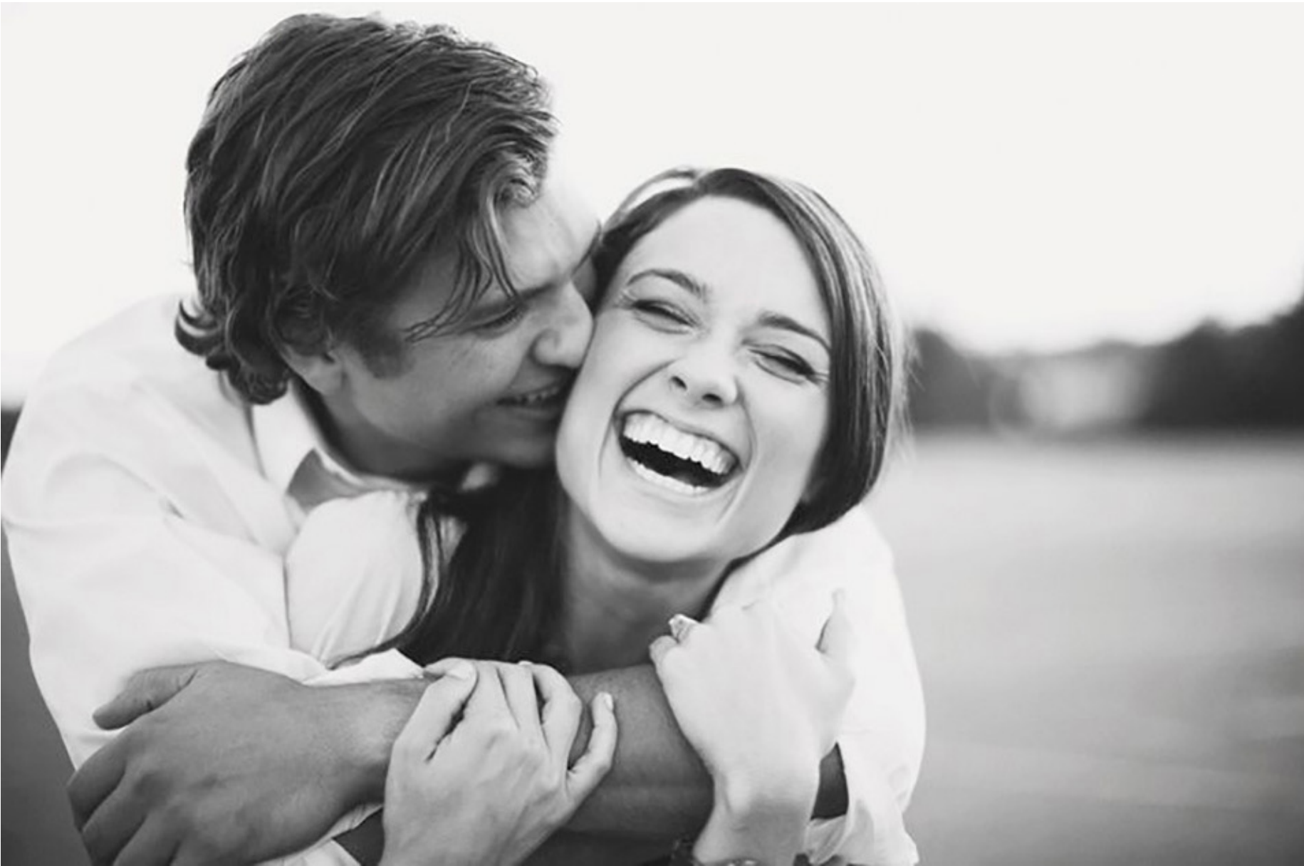
Основа благополучных отношений — доверие и преданность

Но почему тогда не получается? Вроде встретили нужного человека, вроде чувства взаимны... и кажется, что «вот сейчас заживем!». В начале отношений именно так и выходит. Мы друг без друга не можем, на волне влюбленности стараемся изо всех сил, демонстрируем партнеру