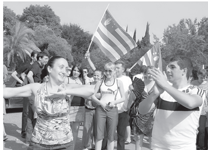
Абхазцы берегут свою уникальную культуру

— Наши приоритеты во внешней политике давно определены и остаются неизменными. Главный из них — это сохранение, развитие и укрепление суверенитета республики. Безусловным приоритетом для нас является стратегическое сотрудничество с Российской Фе-