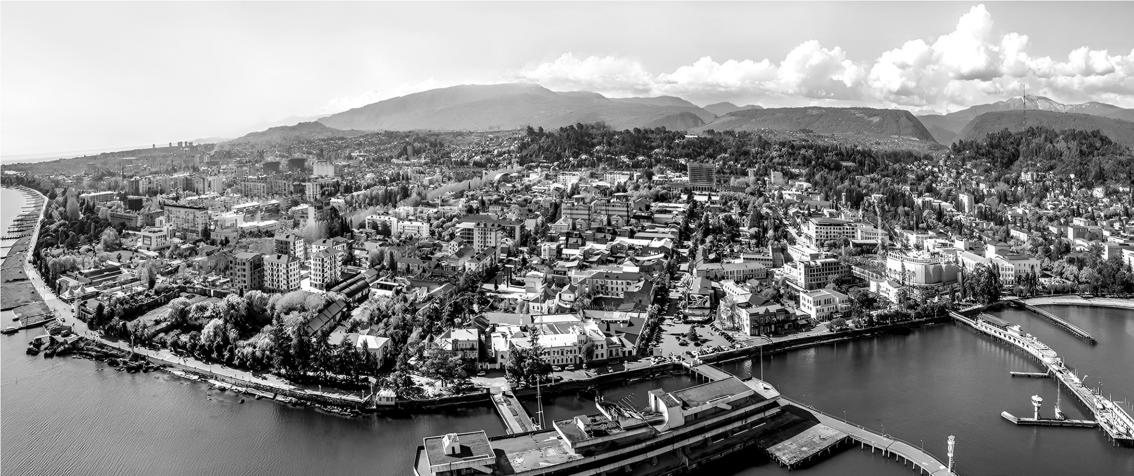
Столица Абхазии — город Сухум

Абхазия — отличная площадка для аграрных проектов. Несмотря на то, что номенклатура нашей продукции пока ограничена, всё, что мы производим, давно зарекомендовало себя высоким качеством. «Произведено в Абхазии» — уже синоним экологичности и чистоты. Мы регулярно участвуем в международных форумах. Например, в те-